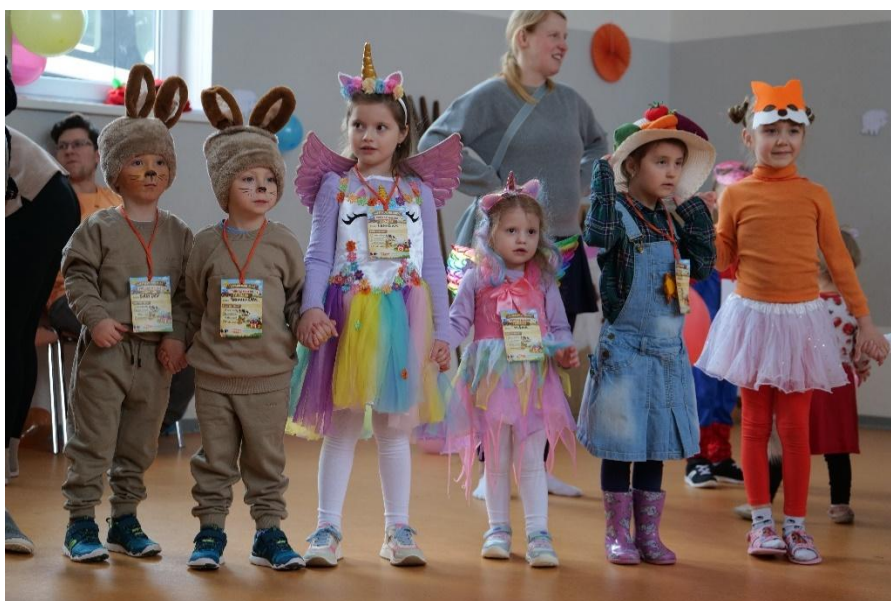
1) Společenský večer – vystupující mládež (31. 1. 2026), 2) „Farmářský karneval“ (15. 3. 2026)